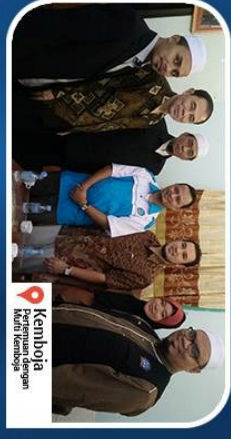
Kamboja Prestium dengan Kerti Kemboja